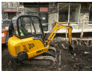
Strada Sf. Dumitru

O contribuție importantă a cercetărilor din această campanie a fost recuperarea parțială a traseului 'Uliței Ișlicanilor', devenită în secolul al XIX-lea 'Strada Franțuzească'.