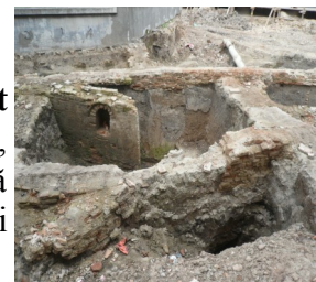
Ruine– Strada Franceză

Acest newsletter prezintă desfășurarea arheologică de pe strada Franceză, incluzând date privind obiectivul arheologic, istoricul cercetării și statigrafia obiectivului.