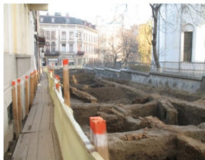
Strada Pictor Tonitza

Potrivit proiectului de reabilitare a rețelelor edilitare din Centrul Istoric al Municipiului București, a fost prevăzută o decapare a carosabilului până la adâncimea de 0,90 m, realizată cu mijloace mecanice, sub supraveghere arheologică. În timpul acțiunii au apărut trasee