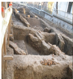
Ruine – Strada Pictor Tonitza

grosime de aproximativ 0,70–0,90 m, a fost săpată și apoi construită rețeaua magistrală de canalizare, cu o lățime de aproximativ 2,20 m. În general, decaparea mecanică a atins extradosul boltii în leagan (având o camășiuță de ciment de epocă contemporană) al acestei canalizări. Un alt aspect a fost acela al modificării pantei terenului.