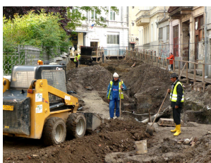
Strada Pictor Nicolae Tonitza