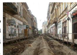
Pregătirea străzii pentru amplasarea utilităților Strada Franceză

Printr-un buletin informativ lunar al proiectului “Reabilitarea străzilor și rețelilor din cadrul Zonei Pilot A, a Centrului Istoric al Municipiului București”, Compania Sedesa și Primăria Municipiului București vă pun la dispoziție informații despre stadiul desfășurării lucrărilor și despre descoperirile arheologice.