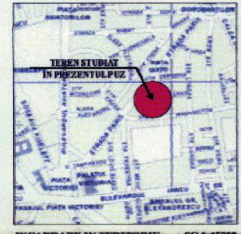
INCADRARE IN TERRITORIU SC:1:15000