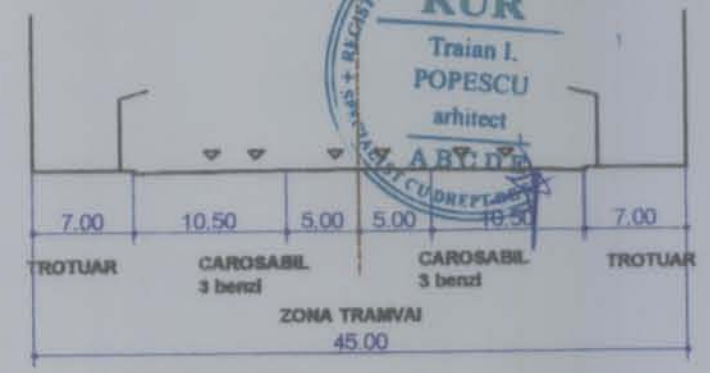
PROFIL STRADAL PROPOS CALEA RAHOVEI