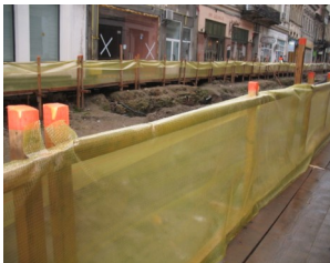
Folie de plastic care are rolul de a semnaliza pericole Strada Franceza