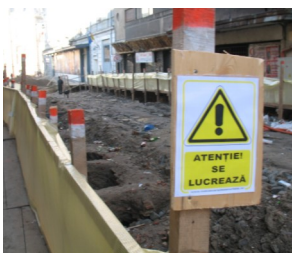
Semnalizari pentru strazi in lucru Strada Franceza

Circulatia personalului si a mijloacelor de transport se va face numai pe caile stabilite, semnalizate corespunzator, conform proiectului de executie.