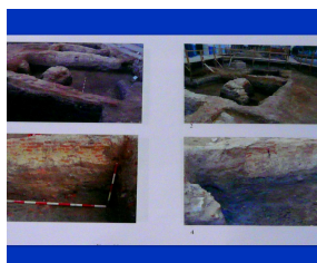
Strada Sfântul Dumitru Secțiunea III

Cercetările arheologice sunt prevăzute să demareze la sfârșitul lunii mai.