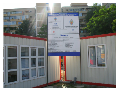
Biroul Relatii cu Publicul Organizarea de santier Centrul Istoric Bucuresti

În speranța unei cât mai bune colaborări, vă invităm să ne vizitați la biroul de Relații cu Publicul , Organizarea de Șantier, strada Șepcari (în spatele Hanului Manuc) pentru informații și sugestii legate de etapele proiectul, din Zona Pilot A.