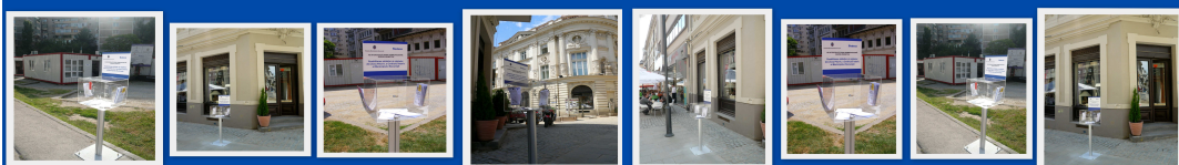
Puncte de Informare - Centrul Istoric București