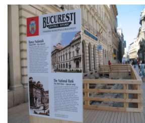
Strada Lipskani - Descoperiri arheologice

"Dintr-o Cartografie a Poliției Bucureștilor, rezultă că în cele 5 plase ale orașului erau 93 de mahalale: mahalaua hanul Filipescului avea 12 case ."