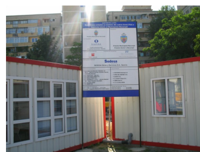
Biroul Relatii cu Publicul Organizarea de santier Centrul Istoric Bucuresti

În speranța unei cât mai bune colaborări, vă invităm să ne vizitați la biroul de Relații cu Publicul , pe strada Șepcari (în spațele Hanului Manuc) pentru informații și sugestii legate de etapele proiectul, din Zona Pilot A.