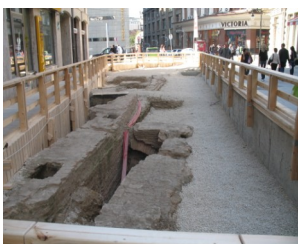
Ruinele Hanului Zlatari Strada Lipscani

Cea mai timpurie referire se face la o Evangheliie greceasca, astazi disparuta, de la biserica Zlatari, dar in manuscrisul romanesc in care s-a pastrat infor-matia despre aceasta evangheliie apare si anul 1760 . S-a presupus ca a fost construita, la inceput, probabil din lemn, pe la