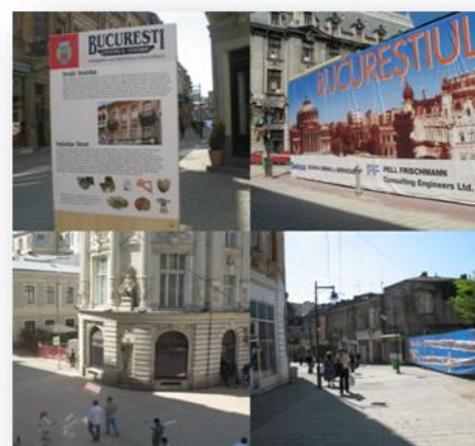
Centrul Istoric Bucuresti

Oraș al contrastelor, marcat deopotrivă de moștenirea bizantină și de mitul “micul Paris”. Așezat la răscrucea drumurilor care legau apusul de răsărit și nordul intracarpatic de sudul balcanic, Bucureștiul s-a confruntat în timp cu un destin advers: de la poziția strategică nefavorabilă și delăsarea locuitorilor, de la frecvențele cutremure, inundații, epidemii, incendii și ocupații ale trupelor străine la buldozerele regimului totalitar și la stridentele intervenții ale tranziției. Mica cetate din secolul al XVI-lea transformată în 1458 de Vlad Țepeș în reședință domnească, a devenit în 1659 capitală a Țării Românești, iar în 1862 a României moderne. După aproape cinci secole de istorie medievală și peste o sută de ani de dezvoltare arhitectural-urbanistică modernă, Bucureștiul a cunoscut demolările “epocii de aur” și, după 1990, presiunea intereselor de afaceri. Intorcându-se acum spre patrimonial său istoric, orașul are șansa de a-și reconstrui destinul.