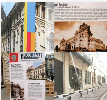
Centrul Istoric București

Cuprins între bulevardele Elisabeta și Carol la nord, Calea Victoriei la vest, bulevardul Corneliu Coposu și Splaiul Dâmboviței la sud și bulevardul Hristo Botev la est, nucleul original al orașului este un loc al memoriei în care straturile trecutului sunt încă vii. Zona comercială tradițională a Bucureștiului, dezvoltată în jurul Curții Domnești începând din secolul al XVI-lea, păstrează încă traseul sinuos al străzilor medievale și vechile pivnițe boltite. Dar clădirile existente, cu excepția unor biserici și