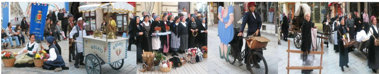
Le Arti per Via – Centrul Istoric București

Cu ocazia “Zilei Bucureștiului”, s-au inaugurat străzile Smârdan și Lipscani din Centrul Istoric, care au primit manifestarea “Le Arti per Via” – meșteșuguri pe străzi, meșteșugari italieni de acum mai bine de 100 de ani. Le Arti per Via- din orașul italian Bassano del Grappa, este mai mult decăt un muzeu ambulant. Este un muzeu, un grup muzical și un teatru de stradă.